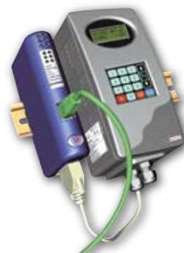
Dans cet exemple Anybus Communicator connecte le port série d'un variateur de vitesse à EtherNet/IP

Dans le mode Maître, le Communicator est configuré pour scanner un nombre d'esclaves, permettant un scénario multi-drop RS485 au niveau de l'installation vers le sous-réseau série. Conçu particulièrement sur mesure pour une communication Modbus RTU, le Communicator exécute des opérations avancées, échangeant seulement des données définies par l'utilisateur vers le bus de terrain. Dans ce mode l'utilisateur peut choisir de travailler avec des commandes Modbus RTU pré-configurées et/ou des transactions entièrement définies par l'utilisateur.